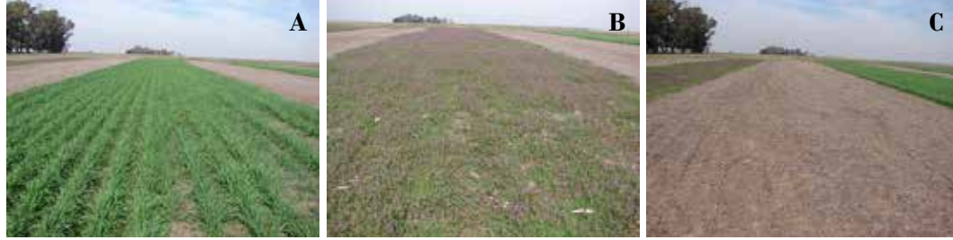
Figura 3. Vista de vicia + triticale libre de malezas (a), vicia con alta infestación de L. amplexicaule florecido (b) y barbecho químico (c). Fotos tomadas el 12 de agosto de 2016.

de CC suprimieron las emergencias primaverales de L. amplexicaule .