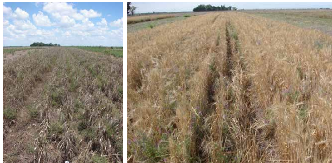
Figura 2. Vistas de las fallas en el secado de V. villosa en el tratamiento V+T.

Ambos tratamientos de CC consumieron una cantidad similar de agua entre siembra y secado, pero la consociación logró producir mayor cantidad de biomasa. Por lo tanto, la EUA de V+T, calculada como biomasa producida en función del agua consumida, fue mayor que la de V (Cuadro 1). En un estudio realizado por Bertolla et al. (2012) con V. sativa ,