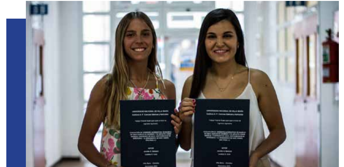
Estudiantes de la UNVM

que se realizó una aplicación antes de la siembra y en el secado, pero se redujo la cantidad de herbicidas aplicados, ya que no se aplicó ningún herbicida residual como en el B y no fue necesaria la aplicación de un graminicida para el control de E. indica resistente a glifosato.