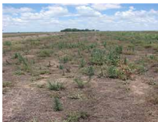
Figura 2. Vista de vicia infestada con Conyza bonariensis el 29 de diciembre de 2016

La siembra consociada de vicia + triticale como cultivo de cobertura redujo la abundancia de L. amplexicaule , D. erodiifolia , C. bonariensis , E. indica y D. sanguinalis entre la cosecha del cultivo de soja y la siembra de maíz tardío. La inclusión de esta consociación, en un lote con infestación de estas malezas, permitiría ahorrar una aplicación de herbicidas en el mes de octubre, si el CC se termina en forma mecánica. En esta experiencia no se redujo el número de aplicaciones herbicidas ya