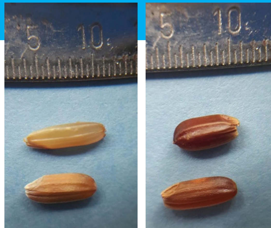
Cuadro 2. Categorías establecidas para las variables morfológicas estudiadas en granos de arroz rojo.