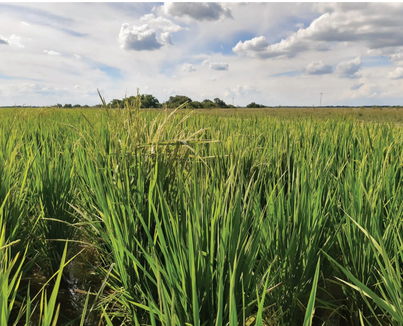
AC 1 planta a campo

Citar como: Fontana & Kruger (2021) Caracterización de arrozces rojos colectados en arrozceras del Nordeste Argentino. Malezas 5, 42-49.