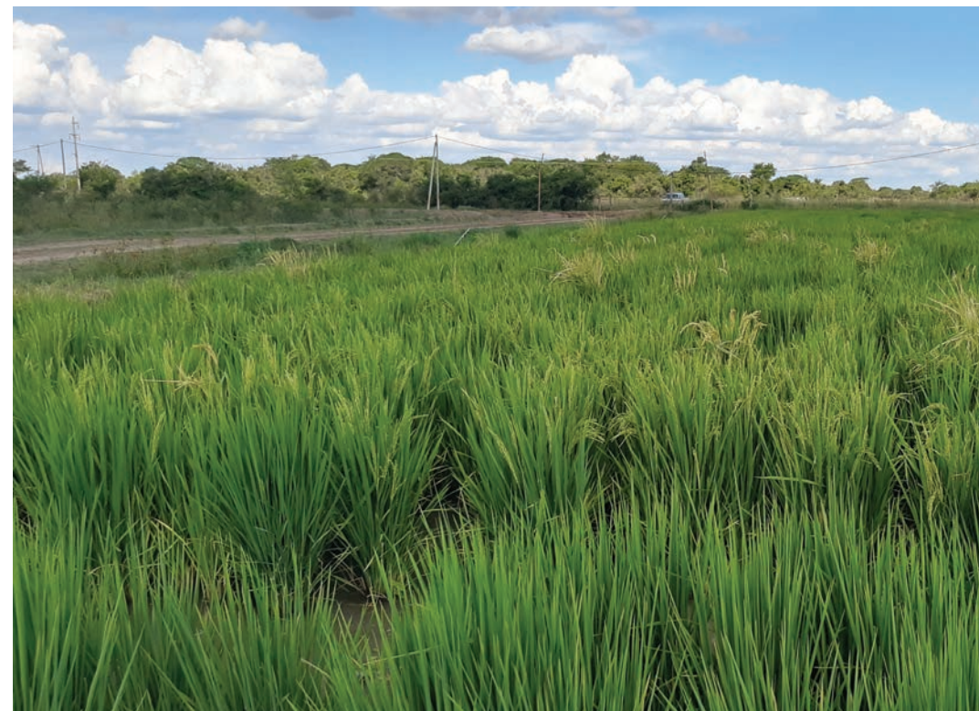
AC varias plantas