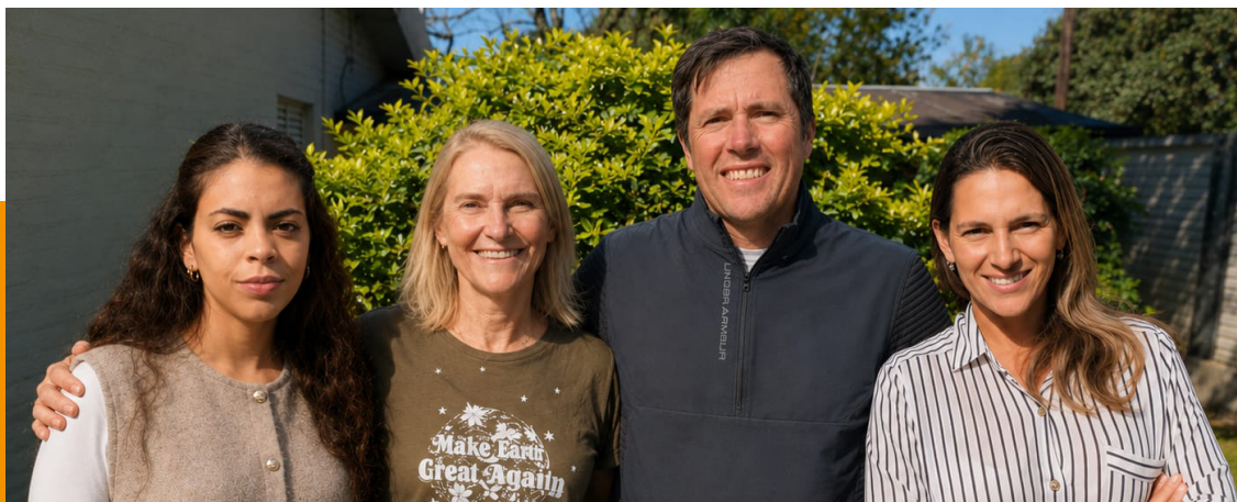
Equipo de investigación

En conjunto, los resultados destacan que una correcta identificación taxonómica, integrada con el conocimiento biológico de las especies, es posible. Esto es clave para diseñar estrategias de manejo más eficientes y sustentables en sistemas agrícolas en siembra directa, y ponen en evidencia la necesidad de profundizar estudios bioecológicos que optimicen su control.