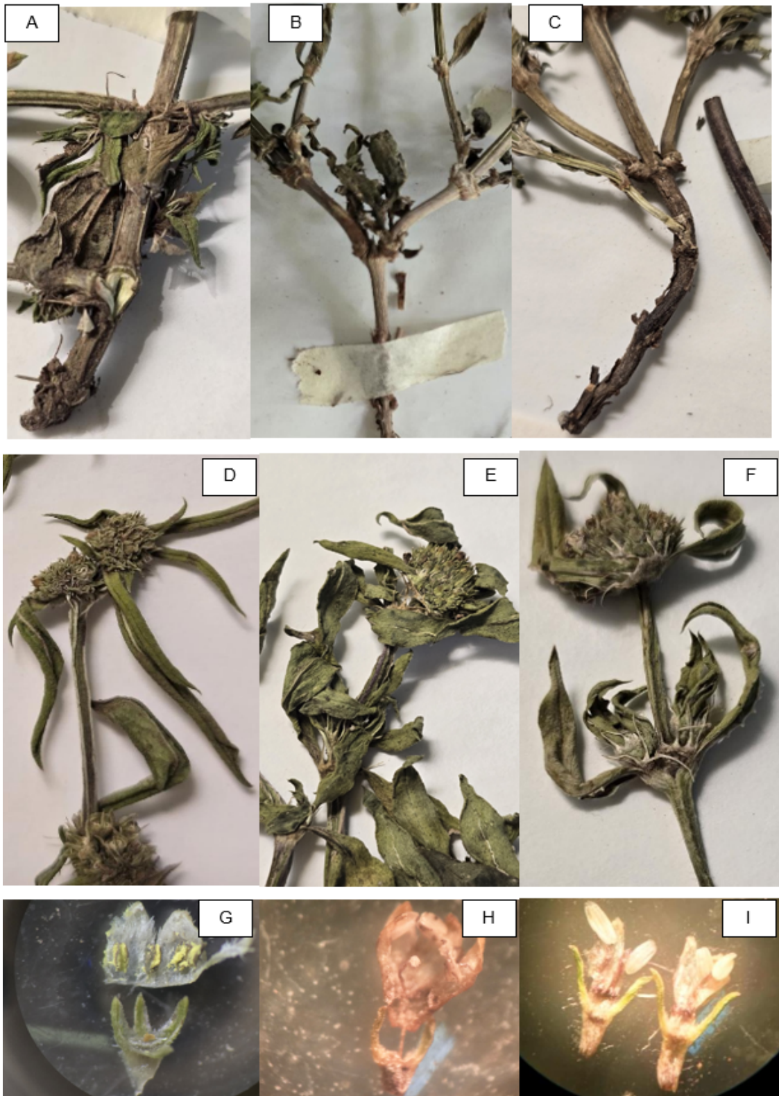
Figura 2. Detalle del tallo, hojas y glomérulos de S. eryngioides (A; D; G), B. spinosa (B; E; H) y B. verticillata (C; F; I). Fotografía de material herborizado tomadas por la Dra. Analía Ruth Salvatore.