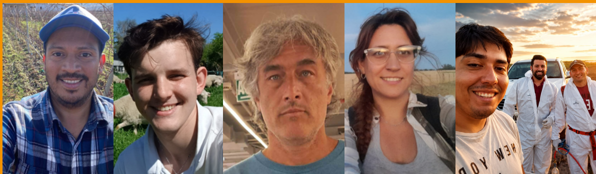
Equipo de investigación

Al Sistema de Chacras de AAPRESID por proveer el material vegetal e insumos para los experimentos.