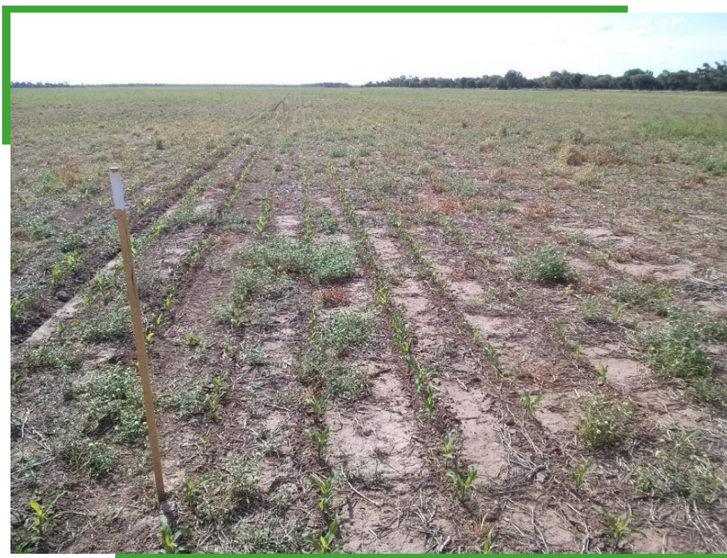
Figura 1. Foto del ensayo realizado en Pampa del Infierno (Chaco) con alta densidad de Borreria spinosa .

El ensayo a campo se llevó a cabo en un lote con presencia de B. spinosa de la localidad de Pampa del Infierno (26° 38' 16,01" S; 61° 19' 54,21" O), en el cual se ensayaron herbicidas con los ingredientes activos flumioxazin y fluroxipir con y sin glifosato. Las aplicaciones se realizaron sin el agregado de coadyuvantes ni humectantes. (Cuadro 1, Figura 1).