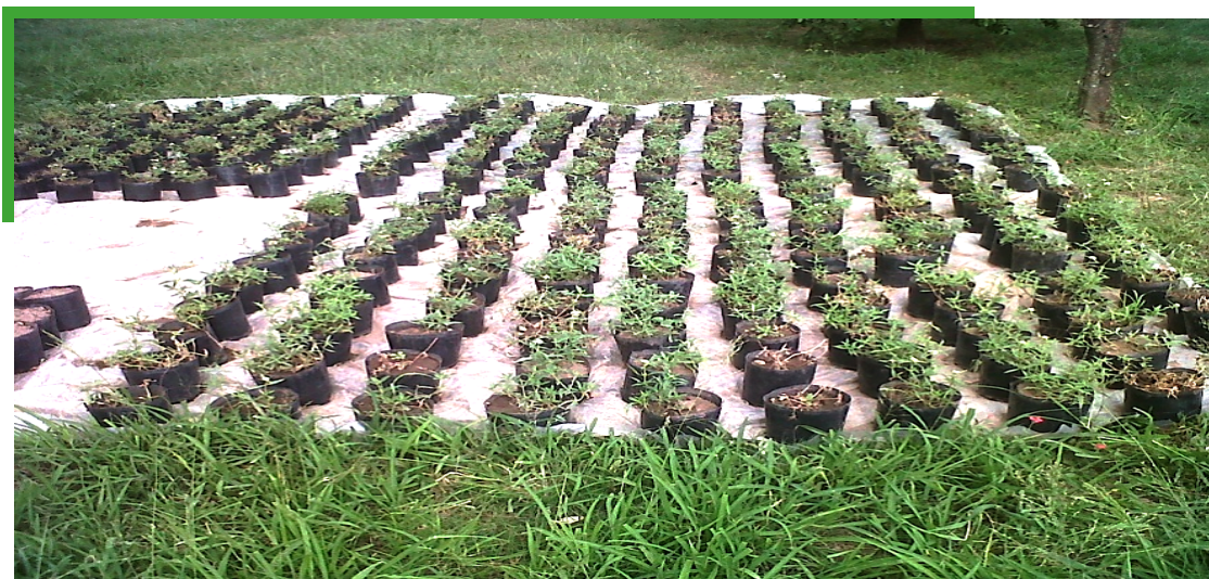
Figura 2. Vista panorámica de las plantas utilizadas en el ensayo de dosis-respuesta de herbicidas para control de Borreria spinosa .

Plantas adultas de B. spinosa , con el xilopodio formado, se recolectaron en lotes con alta presencia de esta maleza y se cultivaron en macetas de polipropileno de 3 l de capacidad con suelo proveniente del sitio de recolección y con orificios de drenaje en la parte inferior (Figura 2).